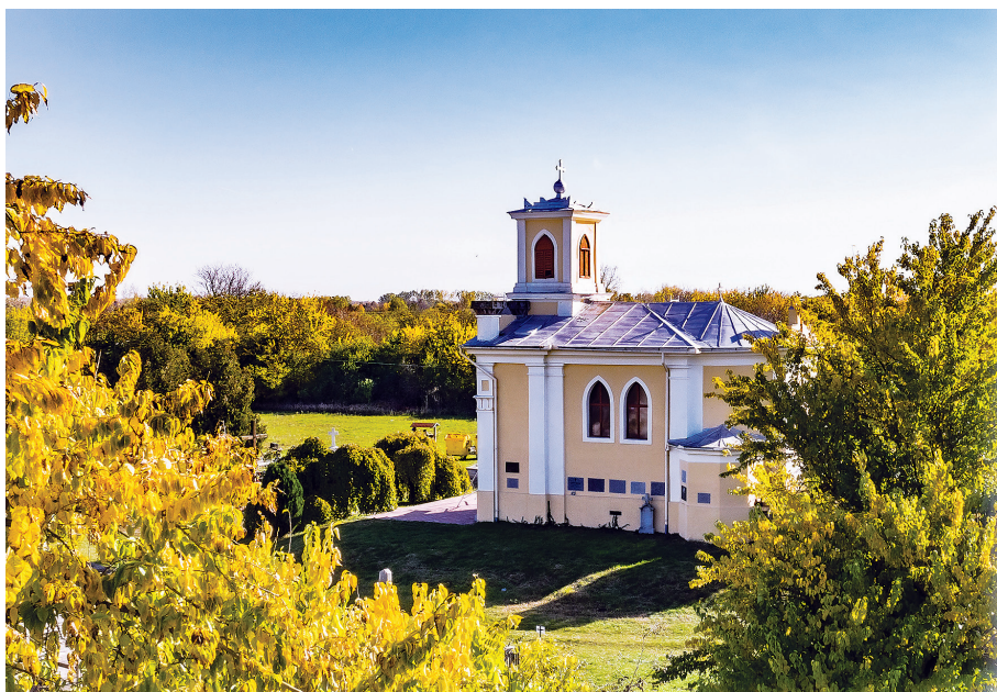
Akaszto-halom a katolikus temetőben, ma a Jantyk-kápolna áll rajta.

28. Bódizné-halma : a békéscsabai országúttól keletre található, kb. 50 méter alapátmérőjű, jelenleg 2-2,5 méter magas rézkori kurgán , topográfiai bejárásakor még felhordási árka is jól látható volt félkörben a déli oldalán. Terepbejárások során néhány őskori és népvándorláskori cserepet találtak, a halom felszínén embercsontok is előkerültek. (Nevének eredete: a hagyomány szerint egy kő jelzi a hajdani dombot, ahol elégették Bódizsnét, az utolsó békési boszorkányt, aki tojást tudott tojni a nyelve alá tett kis kő segítségével.)