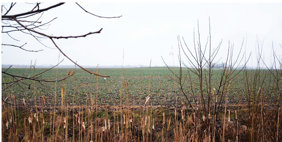
Bódisné halma, ami ma látszódik belőle.

Ezt követően Szelekovszky László ismertette vázlatosan Békés megye kunhalmait 1999-ben, ilyen címmel megjelent könyvében. Gyűjtése azonban elnagyolt, listája helymegjelöléseket nem tartalmaz. A 2002. évvel lezárult ún. Kunhalom-program keretében településünk kunhalmait is felmérték. Ez a kataszter már részletesebb, sokoldalúbb és pontosabb, viszont területünkről nem minden halmot tartalmaz.