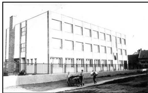
A IV. sz. Általános Iskola és Diákotthon Szánthó utcai épülete az átadás után

A város kereskedelmében sokáig meghatározó volt a helyi ÁFÉSZ, 1978-ban új nagyáruház építését határozták el, mely többszöri határidő módosítás után 1981 őszen nyílt meg. Sokáig csak Iparcikkáruházként emlegették, a rendszerváltás után egymást váltották benne a különböző bérlők és vállalkozások. Az évek során a város több pontján ABC áruházak és kisebb kereskedelmi egységek létesültek. Az ország kereskedelmi hálózatába való bekapcsolódást a Spar Áruház felépítése 1998-ban, majd a következő évben a Penny Market Raktár