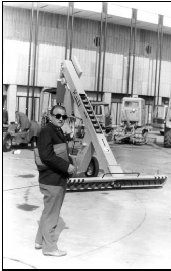
A Mezőgazdasági Gépgyár terméke, a Kuli

SALIX Kosáripári Kft, míg a szövetségéből, némi profilváltással 1983-ban FONTEX lett. Az 1990-es években azonban mindkét üzem lassan elsorvadt. Jelentős létszámmal működött még a várossá avatáskor a Vegyesipari Szövetkezet, az