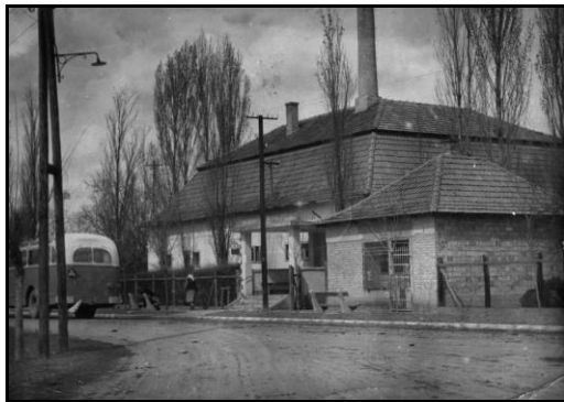
A Gyógyfürdő épülete 1942-ben (képeslap)

A 70-es években kezdődött a Dánfoki Üdülőközpont építése, az intézmény 1981. június 1-én Dánfoki Ifjúsági Tábor néven nyitotta meg kapuit. 1985-re kedvelt nyaralóhellyé vált, nemrég a város visszavette és a Kecskeméti Gábor Kulturális Központ alá integrálta.