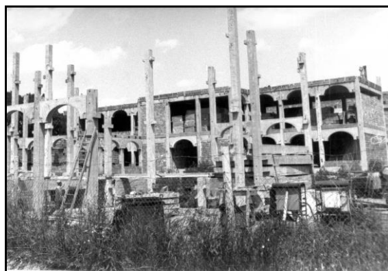
Épül az I. sz. Általános Iskola