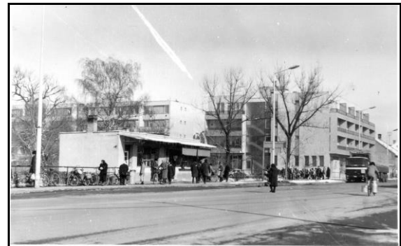
A híd pavilonok elődje

1984-ben a Rákóczi utcán is többszintes társasház épült, a földszinten gyógyszertárral, üzletekkel. 1984-ben átadták a Rendelőintézet új szárnyát, melynek legutóbbi felújítása során 2003-ban betegfelvonó, a mozgáskorlátozottak számára rámpa és akadálymentes vizesblokk készült. 1977-ben kezdődött és 10 év múlva, 1987-ben fejeződött be a város akkori legnagyobb beruházása, a Békési Szociális Otthon bővítése. 1987-ben kezdődött a városon átfolyó Élővíz-csatorna partfalának rendezése, kerékpárutak kialakítása.