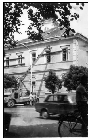
A földrengésben megsérült „Kollégium” falait a sarkokon gerendákkal rögzítették

1978. június 22-én hajnali 3 óra 27 perckor addig soha nem tapasztalt félelmetes morajlásra ébredt Békés lakossága: a Richter skála szerinti 4,5-ös erősségű földrengés rázta meg városunkat. Csütörtök hajnali fél 4-től 4 óráig 6 kisebb-nagyobb földrengés-hullám érte a várost, Békés volt a rengés központja, károk is főként itt keletkeztek. Középületek közül legnagyobb károk a III. számú Általános Iskola („Kollégium”, ma Zeneiskola épülete), a Művelődési Központ (Bérház) és a Szociális Otthon épületében keletkeztek. A helyzetet elsőfokú belvízvédelmi készültség is nehezítette.