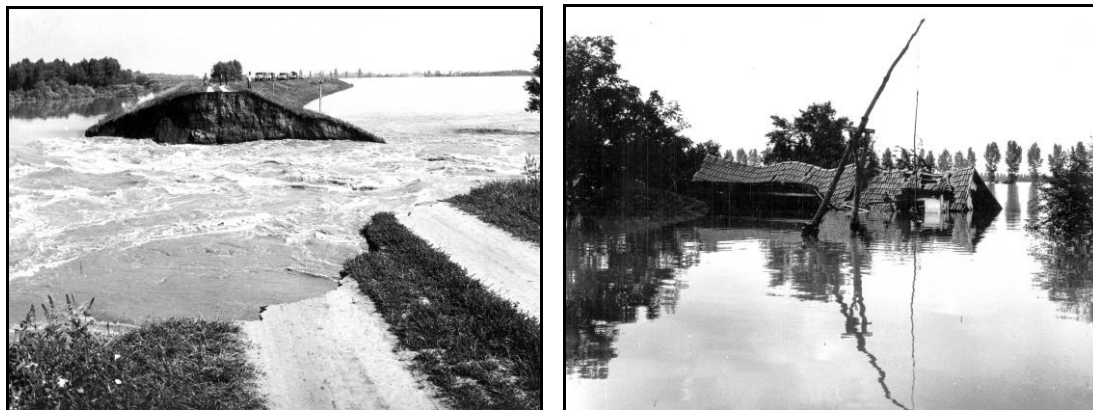
Kettős-Körös gátszakadás, Mementó - 1980

A földrengés után a tanévkezdés is komoly gondok elé állította a várost, a III. sz. Általános Iskola épületét bontásra készítették elő, a diákokat csak a többi iskola tantermeibe tudták elhelyezni. A Művelődési Ház és könyvtár épületét lezárták, a helyreállítás idejére a könyvtárosok ideiglenes helyre, a volt bírósági épület első emeletére költöztek. A város 9 óvodája közül is hetet helyre kellett állítani, még szerencse, hogy a legújabb, a Baky utcai 100 gyereket befogadó óvoda akkor épült.