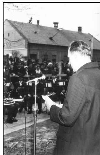
A „Lepkeház” alapkövét a várossá nyilvánítási ünnepségsorozat részeként rakták le

Régióink fő megélhetési forrása a mezőgazdaság és a könnyűipar volt, és bár a városi rang elnyerése lendületet adott Békés infrastrukturális fejlődésének, sajnos a várt ipari fejlődés nem következett be. A mezőgazdaság szervezeti felépítése is jelentős átalakuláson ment keresztül, míg a várossá avatás évében az Október 6, a Kossuth és az Egyetértés Tsz. foglalkoztatta a mezőgazdaságban dolgozókat, a '70-es években a termelési színvonal emelése érdekében a termelőszövetkezetek és az állami gazdaságok egyesültek, így 1979-ben a városban már csak három üzem volt, a Hidasháti Állami Gazdaság, az Egyetértés és a Viharsarok Mg. Tsz. A rendszerváltás nehéz helyzetbe hozta a földdel dolgozókat, mindkét termelőszövetkezetünk részegységekre szakadt. A Viharsarok 1992-ben három önálló gazdálkodású és elszámolású kft-re, a gépi szolgáltatásokat a Borosgyán Kft., a földek művelését, raktározást a Viharmező Kft, a sertéstelepet pedig a Töröksziget Sertéstenyésztő Vállalkozási Kft. üzemeltette. Az Egyetértés Tsz.-ből 9 kft lett, melyeket egy holding fogott össze, legnagyobb a Szarvasmarha-tenyésztő Kft, az egykori növénytermesztési főágazatból alakult a ma is prosperáló Agro-Déló Kft, a sertéstenyésztésre a Pig-Farm Kft szakosodott. A Hidasháti Állami Gazdaságból Hidasháti Mezőgazdasági Rt lett.