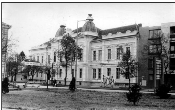
A Városháza 1973-ban, kifeszített ünneplő transzparencsrel