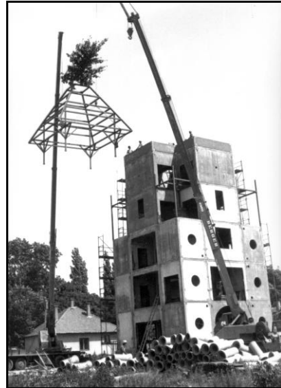
A „Torony” tetőgerendázatának beemelés, Bokréta-ünnepély

2000 nyarán Békés Megye Képviselettestülete 114/2000 (VI.30.) KT számú határozatával az akkor már megyei fenntartásban levő Ipari Szakközépiskolát és 636. sz. Szakmunkásképző Intézetet a Farkas Gyula Mezőgazdasági Szakképző Iskolához és Gimnáziumhoz csatolta. 2011-ben újabb változás következett be, az intézményt további megyei intézményekkel vonták össze, új neve Békés Megyei Tisza