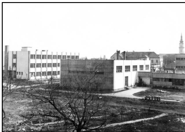
Épül a II. számú, ma Karacs Teréz nevét viselő általános iskola épülete

Áruház átadása jelzi. 2005-ben, ez idáig utolsó nagyáruházként megnyílt a Lidl békési diszkontáruháza.