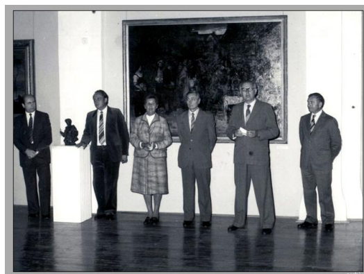
1983-ban nyílt a Békési Galéria a földrengés után helyreállított Bérház épületében.

2000-ben mélyreható változás következett be a múzeum működésében, testületi döntés született a városi kezelésbe vételéről. Így 2001. január 1-től városi múzeumként működik, a