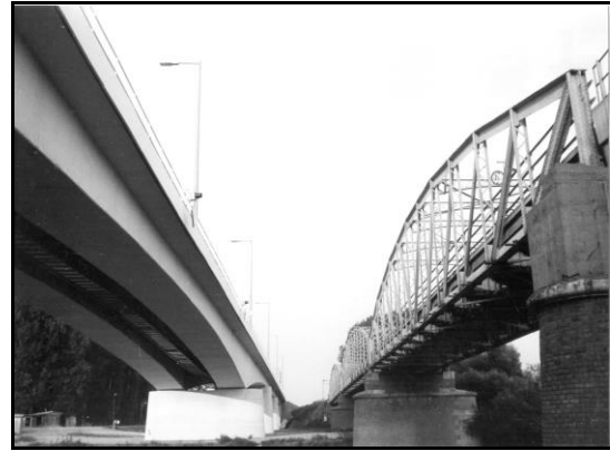
1980-ban megsérült a Kettős-Körös hídjának tartószerkezete, az új és a régi híd egymás mellett

1980 augusztusában egy tehergépkocsi megrongálta a híd vasszerkezetét. 1982-ben kezdődött az építkezés, az utolsó elemek beemelése után 1984. szeptember 19-én került sor a hagyományos hordógurításra. Az ünnepélyes hídavatás 1985. augusztus 16-án volt.