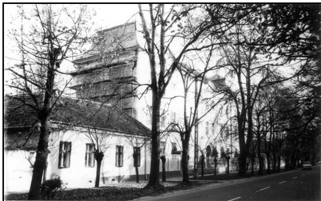
A Középiskolai Kollégium helyén állt épület

2000-ig három középiskola volt városunkban. A SZKIRG-ről már szoltunk, az 1902 óta folyamatos mezőgazdasági képzés az 1979-ben, majd 1989-ben is új iskolaépületet avató – korábban Fehér Lajos nevét viselő – Farkas Gyula Mezőgazdasági Szakközépiskola és Szakképző Intézetben folyt, ami 1994-től gimnáziumi képzéssel is kiegészült. Ipari szakképzés 1884-től volt Békésen, 1986-ig a 636. sz. Szakmunkásképző Intézetben, mely 1969-ben kapott új, önálló épületet a Vásárszállán. 1986-ban Békés Város Tanácsa VB. 100/1984-es határozatával a gimnázium korábbi szakközépiskolai osztályait leválasztotta („profiltisztítás”), így a továbbiakban az intézmény Ipari Szakközépiskola és 636. sz. Szakmunkásképző Intézet néven működött tovább.