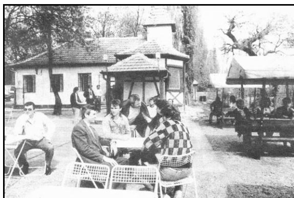
A Bagoly 1988-ban

1988-ban a Bélmegyeri Újbarázda Tsz. rendbe hozta a békési sportkör Körös-parti romos, műemlék jellegű épületét és Bagoly Söröző néven új kisvendéglőt nyitott, mely egymást váltó tulajdonosokkal, de ma is hangulatos étkezőhelyként működik. 1991-ben kezdődött a tervezés a piac modernizálásával kapcsolatban, 1993-ban az építkezés is megindult, hosszú idő után sokak kívánsága is teljesült a piac 2005-ben elhatározott, majd 2 év múlva történt lefedésével.