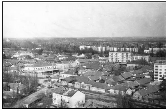
A város látképe a modern lakótömbök megjelenése előtt – majd évtizedek alatt fokozatosan hódították meg a várost a többszintes lakótömbök

1993-ban a Sportcsarnok átadásával fejeződött be a Nevelési Központ 10 éves fejlesztésének utolsó beruházása, ezzel teljessé vált a Jantyik és Csíkos utcai oktatási és kulturális komplexum. Ebben az évben városi tulajdonba került a munkásörség épülete, itt avatták 1998-ban a Civil Szervezetek Házát, a földszinten a Békés Megyei Munkaügyi Központ békési kirendeltsége kapott helyet. (2008-tól a Békési Civil Szervezetek Háza a Hőzső utcába költözött.) Mögötte hangulatos szökőkutas terecskét alakítottak ki.