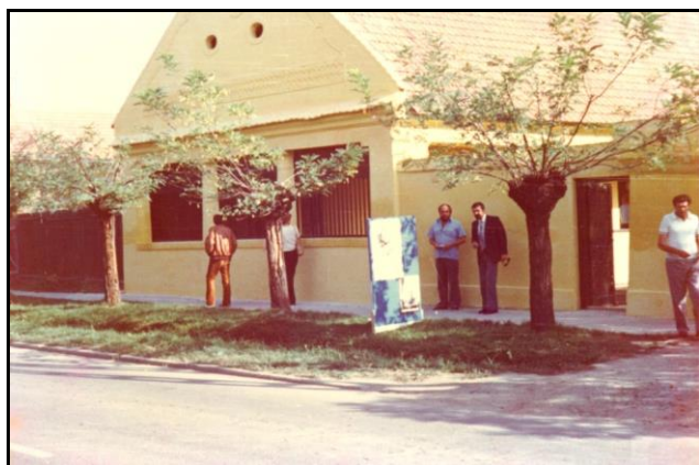
1981-ben avatták az Iskolamesteri Lakást

1981. október 8-án a Népi Építészeti Tanácskozás alkalmából a Petőfi utca 41. szám