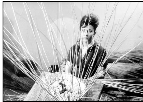
Kosárfonás a Békési Háziipari Szövetkezetben - 1970

Hagyományos mesterség városunkban a kosárfonás, a várossá avatáskor két, esetenként több száz dolgozóval működő üzem is volt: a budai székhelyű Erdőgazdaság Fűz- és Kosáripári Vállalat békési kosárgyára és a Békési Kosárfonó Háziipari Szövetkezet, mindkettő főként exportra termelt. A változó körülmények itt is megkövetelték az alkalmazkodást, a kosárgyárból