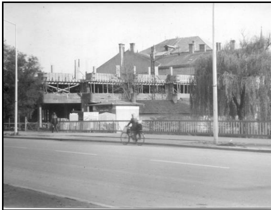
A Lepkeház építkezése

Még 1973-ban döntés született a Karacs Teréz utcai lakótelep kialakításáról, 1974-ben a korábbi kisebb épületek után a Fáy utcán is soklakásos tömbházak építése kezdődött, a Széchenyi tér 1. szám alatti háznál elkészült városunk első modern üzletsora. Ekkor kezdődött az Ady utcai lakótelep, a Fáy utcai tömbök építése, napjainkig a városiasodást tükröző, kivitelezésükben egyre szépülő tömbházakban másfélezer öröklakás került átadásra. 1975-ben nyitották a szintén többszintes házakból álló Karacs Teréz utcát.