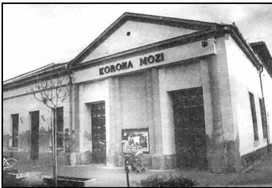
Mi lesz veled, Mozi? - 2000

1993-ban a Sportcsarnok átadásával fejeződött be a Nevelési Központ 10 éves fejlesztésének utolsó beruházása, ezzel teljessé vált a Jantyik és Csíkos utcai oktatási és kulturális komplexum. Ebben az évben városi tulajdonba került a munkásörség épülete, itt avatták 1998-ban a Civil Szervezetek Házát, a földszinten a Békés Megyei Munkaügyi Központ békési kirendeltsége kapott helyet. (2008-tól a Békési Civil Szervezetek Háza a Hőzső utcába költözött.) Mögötte hangulatos szökőkutas terecskét alakítottak ki.